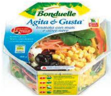
Agita e Gusta di BONDUELLE