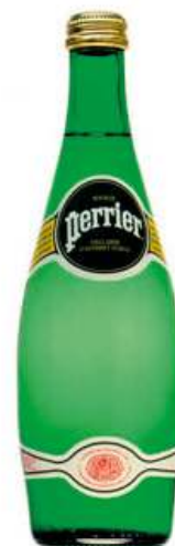
Perrier CTM 001231737

In tema di marchio “tridimensionale”, si fa cenno alla recentissima sentenza della Corte di Giustizia UE del 16 settembre 2015 – nella causa C-215/14 – inerentemente alle questioni sollevate con riferimento alla domanda di registrazione come marchio, nel Regno Unito, della forma del Kit Kat, un wafer ricoperto di cioccolato composto da quattro barrette ove si trova ribadito il principio di impedimento alla registrazione della forma di un prodotto quando essa è imposta dalla stessa natura del prodotto ed è, altresì, necessaria per ottenere un risultato tecnico da intendersi quale modo in cui il prodotto “funziona” e non, invece, con riferimento alle modalità con cui esso è fabbricato.