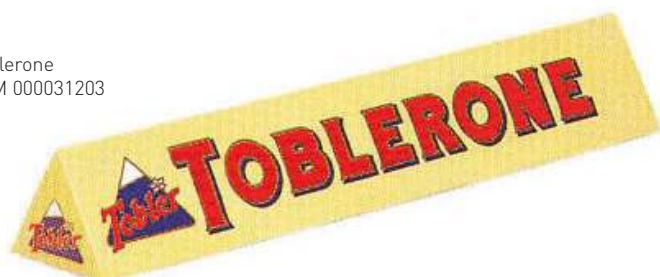
Toblerone CTM 000031203

In tema di marchio “tridimensionale”, si fa cenno alla recentissima sentenza della Corte di Giustizia UE del 16 settembre 2015 – nella causa C-215/14 – inerentemente alle questioni sollevate con riferimento alla domanda di registrazione come marchio, nel Regno Unito, della forma del Kit Kat, un wafer ricoperto di cioccolato composto da quattro barrette ove si trova ribadito il principio di impedimento alla registrazione della forma di un prodotto quando essa è imposta dalla stessa natura del prodotto ed è, altresì, necessaria per ottenere un risultato tecnico da intendersi quale modo in cui il prodotto “funziona” e non, invece, con riferimento alle modalità con cui esso è fabbricato.