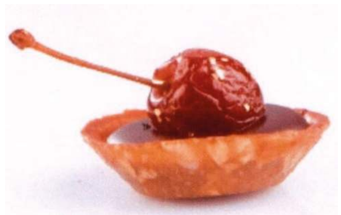
Labeyrie Traiteur Surgelés RCD N. 654991-0005 (design registrato il 19.01.2007 e scaduto il 19.01.2012)