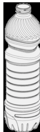
Acqua minerale San Benedetto S.p.A.

Un vivace dibattito e differenti prese di posizione sono state assunte con riferimento ad una ancora attuale decisione del 2013 stabilita dalla Corte Federale Tedesca, la quale ha stabilito che anche la composizione di un piatto è protetta dal diritto d'autore, inibendone di conseguenza la facoltà di poterla liberamente fotografare al ristorante per, poi, postare e condividerne le immagini scattate, in particolare sui social network (pratica sempre più diffusa che, in gergo, è definita "food porn") ampliando l'ambito di protezione del copyright andandovi a ricomprendere anche l'aspetto e la presentazione del cibo curato dallo chef.