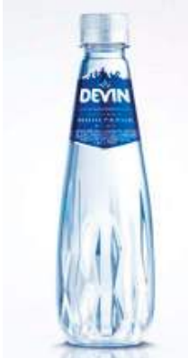
Crystal Line di DEVIN, 2014 Premio imballaggio 2015, design