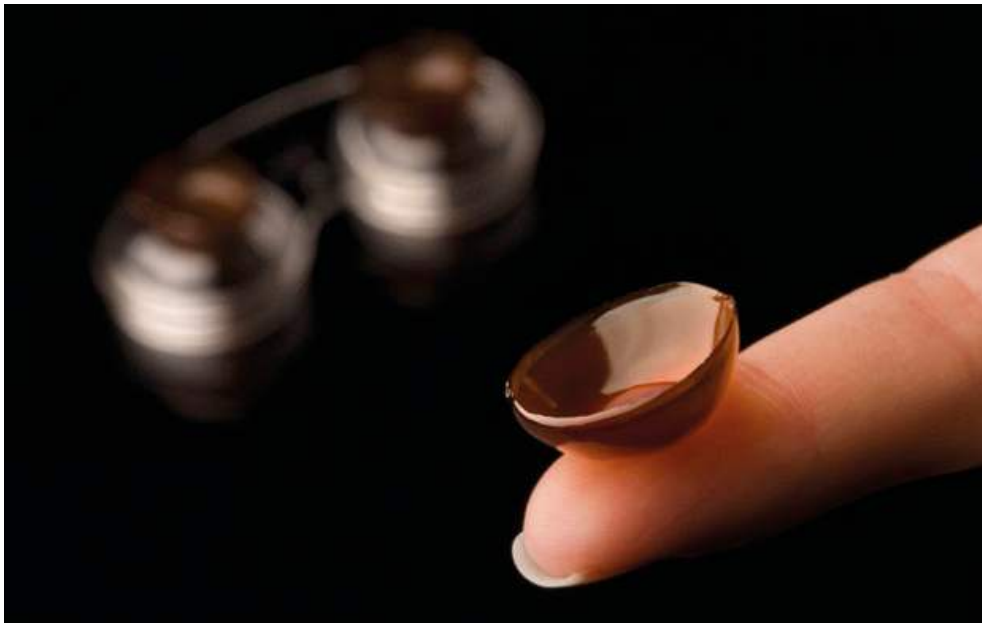
Lenti a contatto di caffè di Carlo Cracco