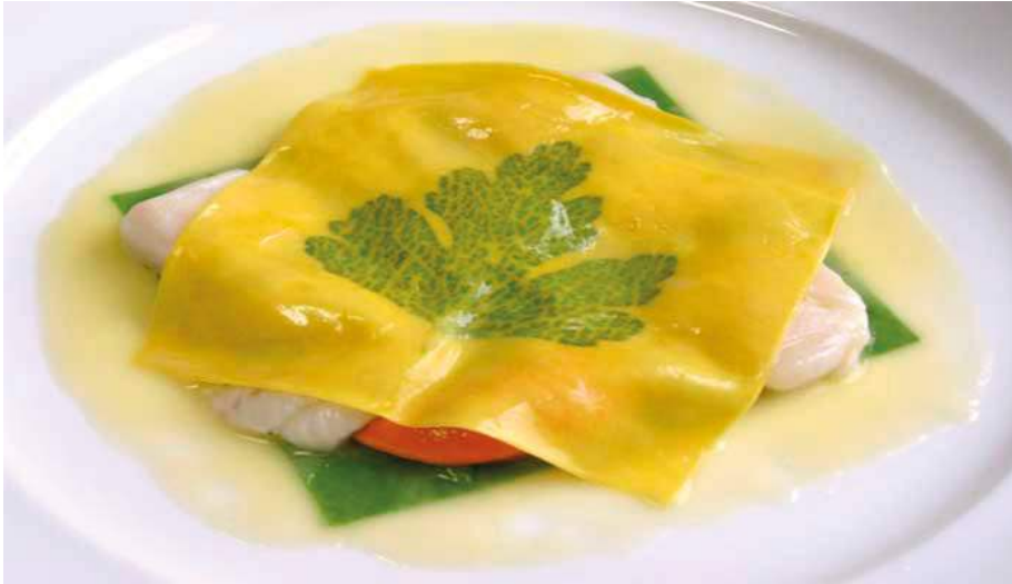
Raviolo aperto di Gualtiero Marchesi

da cui emerge l'estro nostrano dello chef o del ristoratore;