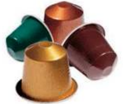
Le capsule da caffè NESPRESSO di Nestlè